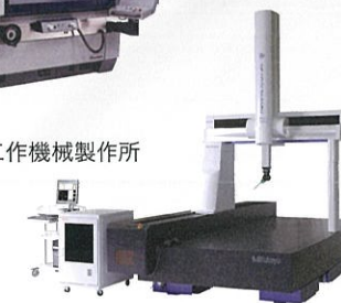
株式会社ミットヨ 三次元測定機 CRYSTA-Apex EX