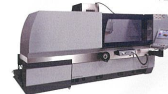
株式会社岡本工作機械製作所 PSG84CA-iQ