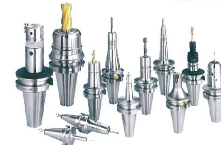
BIG DAISHOWA 株式会社