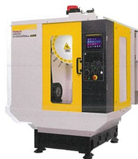
ファナック株式会社 ROBODRILL α-DiB5Plus