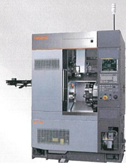
高松機械工業株式会社 XT-6/XT-6M