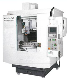
株式会社スギノマシン セルフセンター V15-LX