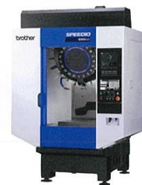
ブラザー工業株式会社 S500Xd2