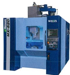
株式会社松浦機械製作所 MX-520