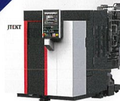
株式会社ジェイテクト G1シリーズ