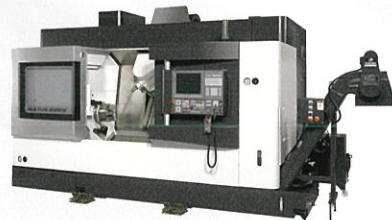
オークマ株式会社 MULTUS B300 II