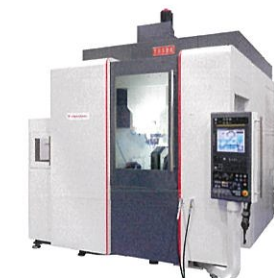
安田工業株式会社 YBM Vi40 Ver III