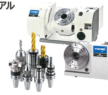
YUKIWA ユキワ精工株式会社