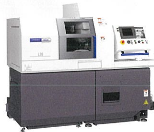
シチズンマシナリー株式会社 Cincom L20