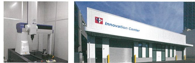
本社測定室（三次元、他） イノベーションセンター（2022年12月完成）