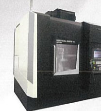
株式会社太陽工業 VERTICAL MATE85