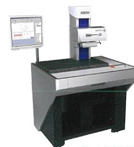
株式会社東京精密 表面粗さ・輪郭・形状測定機 SURFCOMNEX200